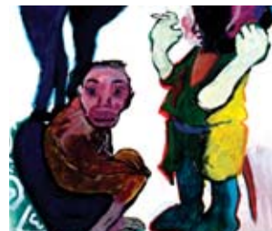
PAULA REGO É OUTRO DOS NOMES DESTA COLECÇÃO

Picasso, Dali, Miró, Paula Rego, Júlio Resende e António Pomar são apenas alguns dos artistas representados na Exposição de Arte Moderna e Contemporânea - Colecção António Piné, patente na sede Associação Nacional de Farmácia (ANF). São 44 trabalhos, de pintura e escultura, que integram uma vasta colecção de 140 peças, no valor de três milhões de euros, doada à ANF pelo seu antigo proprietário. A entrada é livre.